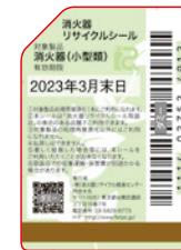
既製品用シール (見本)