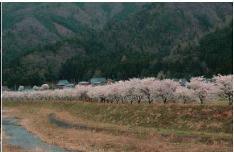
▲名田庄地域の桜(名田庄中)