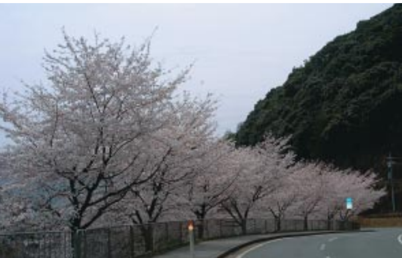
▲大飯地域の桜(大島)

春といえばやっぱり桜。ピンク色の景色にはなぜか心が和みます。町内でも各所で咲き乱れ、美しく咲いた桜の花が、道行く人々の目を楽しませていました。