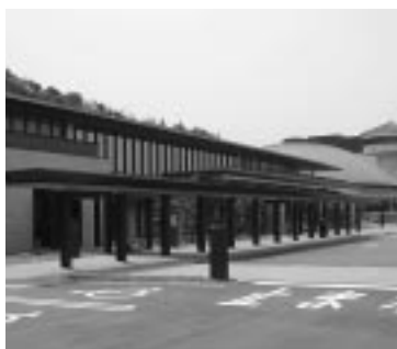
一部完成した保健・医療・福祉総合施設「なごみ」

「なごみ」の一部完成に伴い、4月3日から保健福祉業務窓口の一部が変更となりました。 「なごみ」で行う主な業務 国民健康保険、介護保険、福祉医療、老人医療、社会福祉、児童・母子福祉、障害者福祉など 健康センター業務(母子・成人・老人保健、保健指導、食生活改善等) ※住民票交付などの戸籍窓口サービス等については、従来どおり役場で行います。お間違えのないようご注意ください。協力をお願いします。