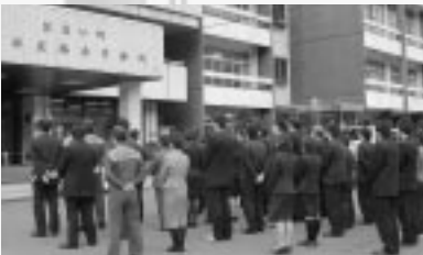
▲名田庄総合事務所での開庁式