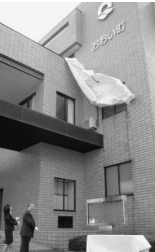
▲かけ声に合わせて幕が下り、おおい町の銘板が顔を出すと、職員から歓声と拍手がわき起こった。