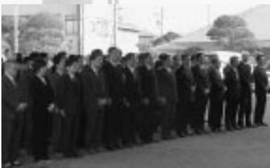
▲おおおい庁舎での開庁式