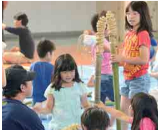
↑本郷小学校で行われたPTA親子松明作り

グループ活動とは別に、実行委員全体で行う作業も多くあります。大火勢の作成は実行委員で行っていて、萱刈り、横棒制作、小火勢(大火勢のミニチュア版)作成など多くの作業があります。他にも地域の方々に協力していただく松明作りなどスーパード大火勢は町民全員で作ります。