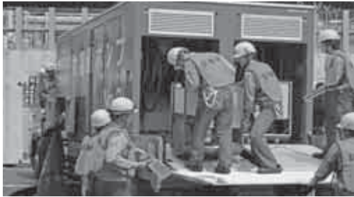
大容量ポンプを用いた、冷却水系統への海水供給訓練