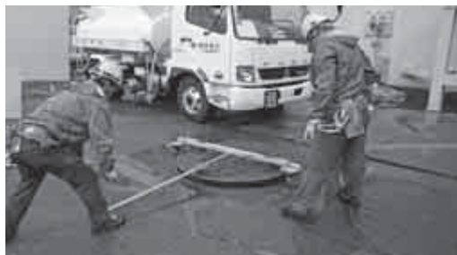
長期にわたる事故を想定した燃料補給訓練