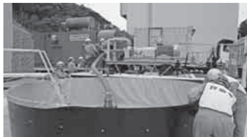
可搬式代替低圧注水ポンプを用いた、原子炉への注水訓練