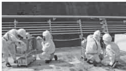
可搬式モニタポスト設置訓練