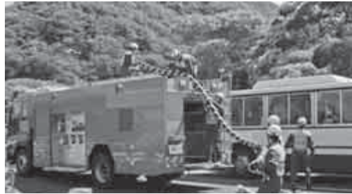
送水車を用いた、使用済み燃料ピットなどへの海水供給訓練