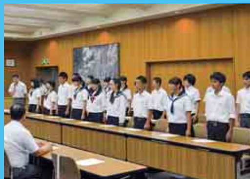
中学生海外派遣事業結団式 （7月28日 おおい町役場）