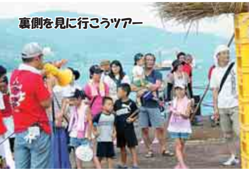
裏側を見に行こうツアー