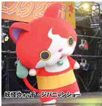
妖怪ウマ子・ジバニャンショー