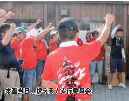
本番当日、燃える！実行委員会