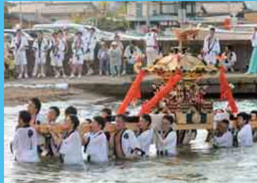
水無月祭 （7月25日 本郷地区一円）