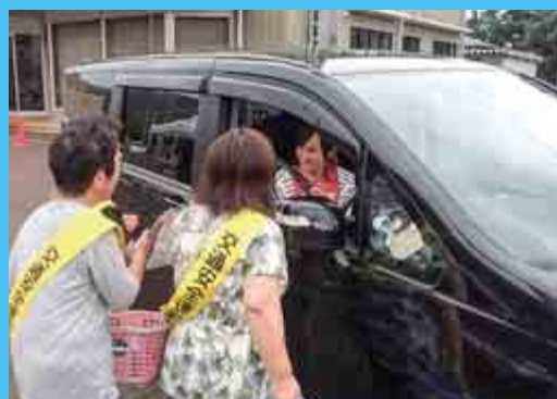
交通安全茶屋 （7月22日 大飯駐在所前）