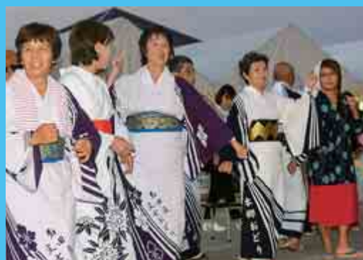
ふるさと踊りフェスティバル （8月7日 うみんぴあ大飯）