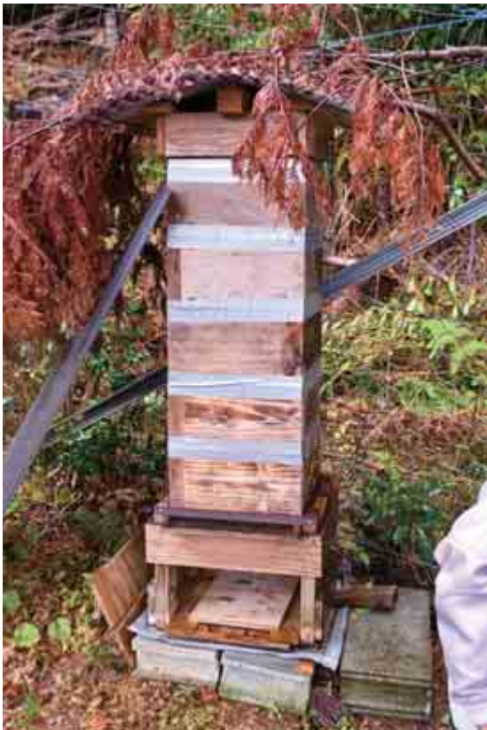
▲ 梅畑に設置された手作りの巣箱。足元にはアリの侵入を防ぐためのカエシが設置されている。この他にも巣箱を持ち上げる装置なども自作。

松 …楽しいですよ。ルーアー（ミツバチをおびき寄せる装置）以外は全部手づくりです。もう、ミツバチが可愛くなって仕方ないんですよ。アリやスズメバチ対策で手づくりトラップも作りました。巣箱にくるスズメバチは、刺激せずに飛び去るのを待った方が良くアドバイスももらったのですが、ミツバチが連れ去られたりするのが許せなくて……。