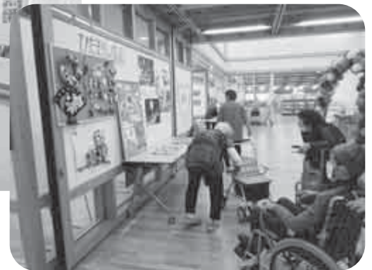
名田庄公民館「里山まつり作品展示」