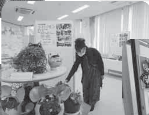
大島公民館「秋の作品展」