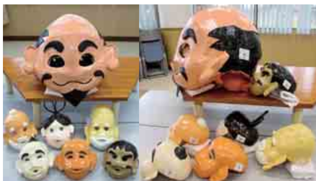
▲ コミュニティ助成事業で整備された祭礼用備品

大島地区で、「大島子どもみこし保存会」が主催の伝統行事として、まちの活性化や町民相互の和を図ることを目的に行われてきた「子どもみこし」。 宝くじ社会貢献広報事業として、一般財団法人自治総合センターが実施している「コミュニティ助成事業を活用し、子どもみこし」で使用する立派な祭礼用備品の整備を行いました。