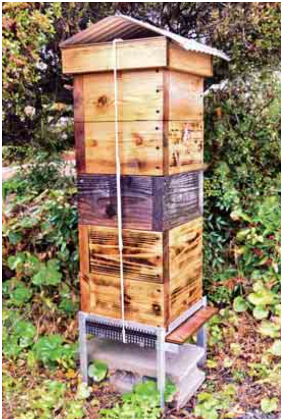
▲庭に設置された手作りの巣箱。ハチミツの味を悪くすると言われていたセイタカアワダチソウなどを刈り取るなど、週末などに家族で手入れをしている。