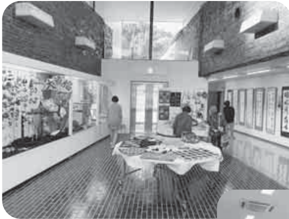
佐分利公民館「佐分利地区作品展示会」

今年度は、新型コロナウイルス感染症の影響により、おおい町民文化祭が中止となったため、各公民館で地域住民の作品展示の場が設けられました。