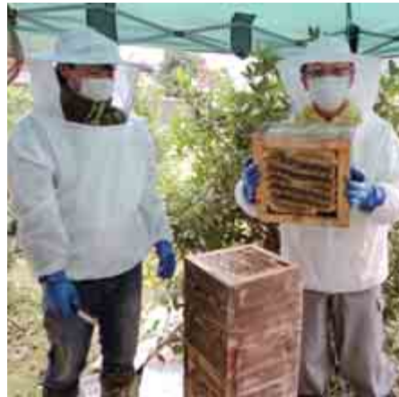
▲ 巣箱を分離し採蜜