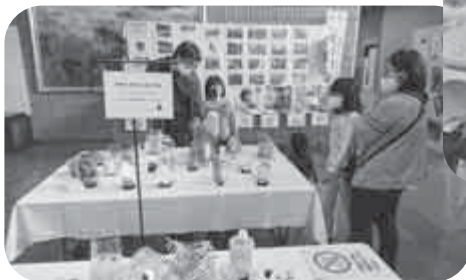
本郷公民館「ちよこつと作品展」