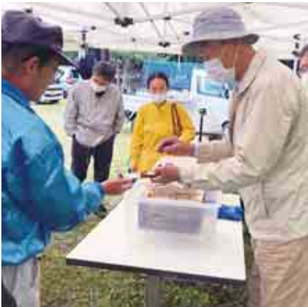
▲ 採れたハチミツの試食