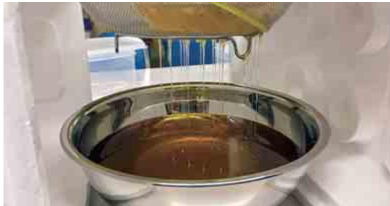
令和2年8月末の採蜜の様子