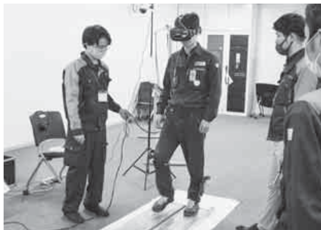
【転落の疑似体験をする様子】