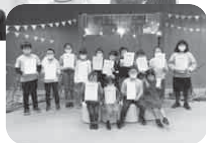
みんな頑張って絵本の魅力を伝えました