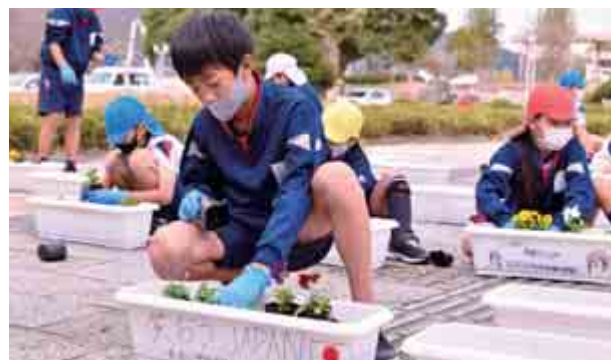
社会福祉協議会と本郷小学校5年生たちが、「コロナに負けるな」をテーマにメッセージを書いたプランターに花の苗を植えました。 (11月25日(水) 本郷小学校)