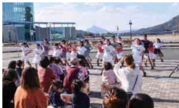
キッズダンスチーム『Gruppo (ぐるっぽ)』のダンスイベントが開催されました。チョコマシュ・フラワーズのダンスや大飯プレイズの太鼓などに来場者は盛り上がりました。(11月15日(日)道の駅うみんぴあ大飯)