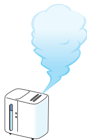
部屋の 適度な湿度

インフルエンザは、主に、咳やくしゃみの際に口から発生する小さな水滴（飛沫）によって感染します（飛沫感染）。普段から“咳エチケット”（①他の人に向けて咳やくしゃみをしない、②咳やくしゃみが出るときはマスクをする、③手のひらで咳やくしゃみを受け止めたら手を洗うことなど）を心がけてください。