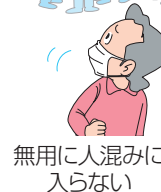
無用 に人混み に入らない